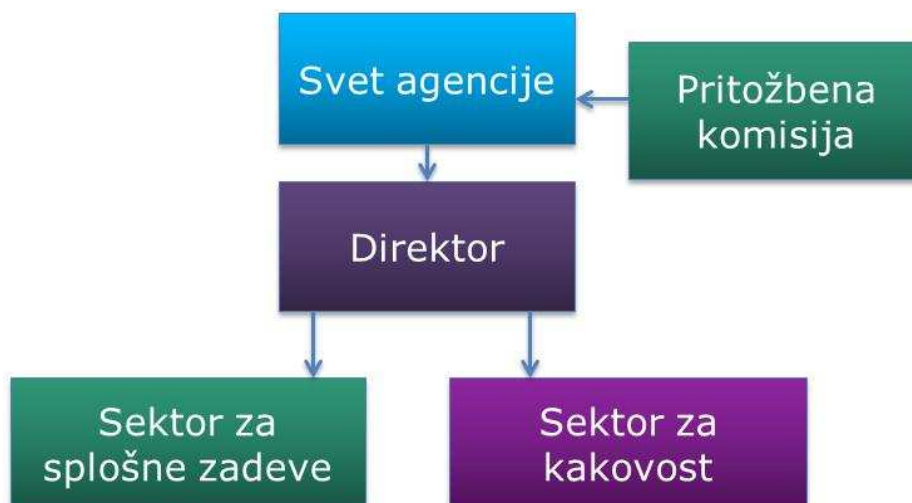
Slika 1: Organizacijska shema agencije

Agencijo sestavljajo: svet kot organ odločanja na prvi stopnji in pritožbena komisija kot organ odločanja na drugi stopnji ter strokovne službe, ki jih vodi direktor, imenovan s strani sveta za obdobje petih let.